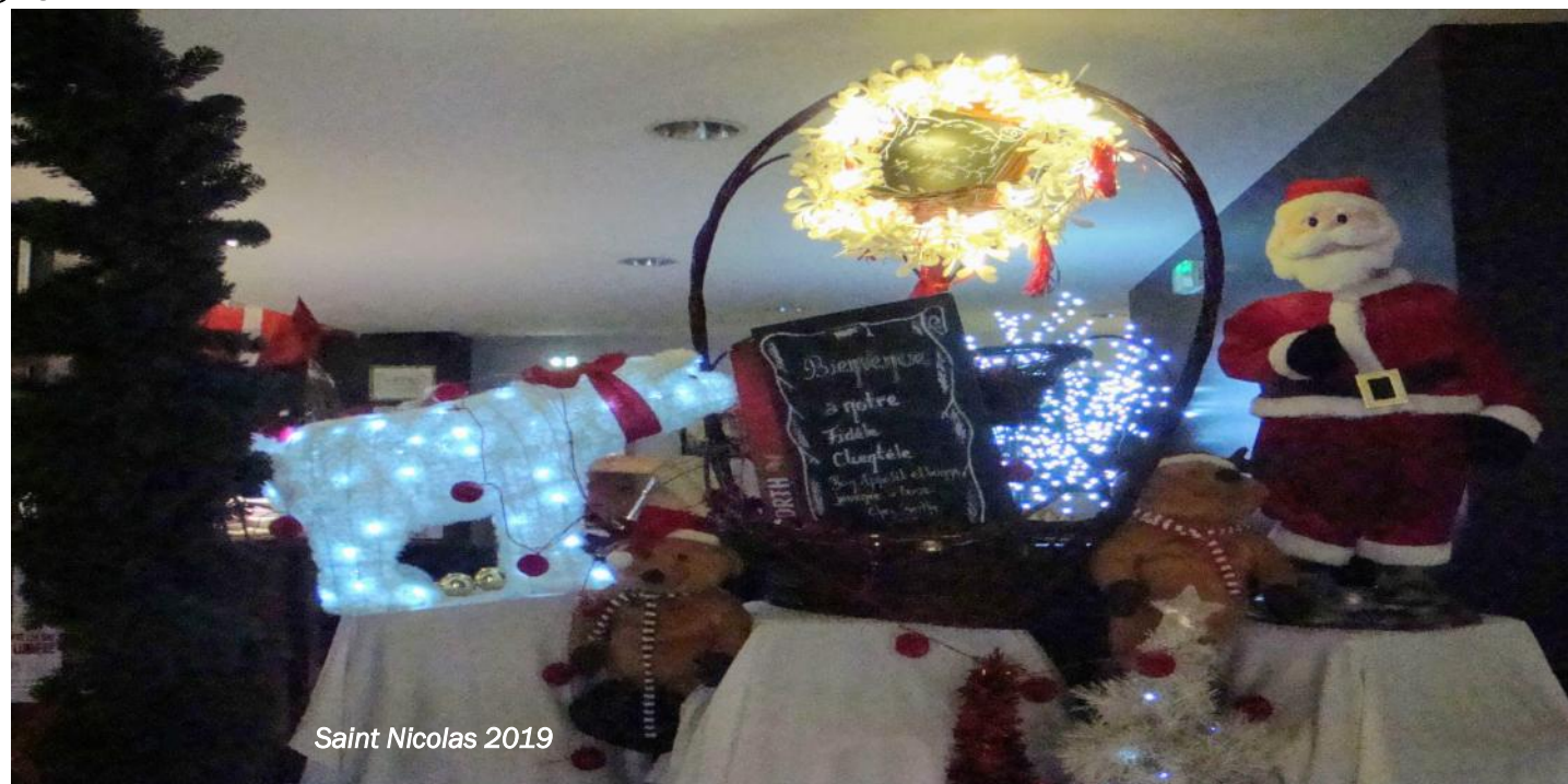
Saint Nicolas 2019