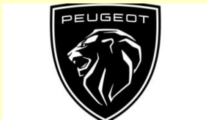
Nouveau Logo Peugeot

Dans le cadre de la nouvelle organisation du Groupe, il est nommé responsable du cluster Upper, qui regroupe les sites produisant des véhicules du segment supérieur ( ex-périmètres PSA et FCA ), ce qui englobe huit sites. À savoir : Rüsselsheim et Eisenach, en Allemagne, Cassino, Melfi et Pomigliano en Italie ainsi que Mulhouse, Rennes et Sochaux. « Je vais désormais concentrer mon énergie à la réunion des deux univers industriels au sein d'une même famille » dit-il.