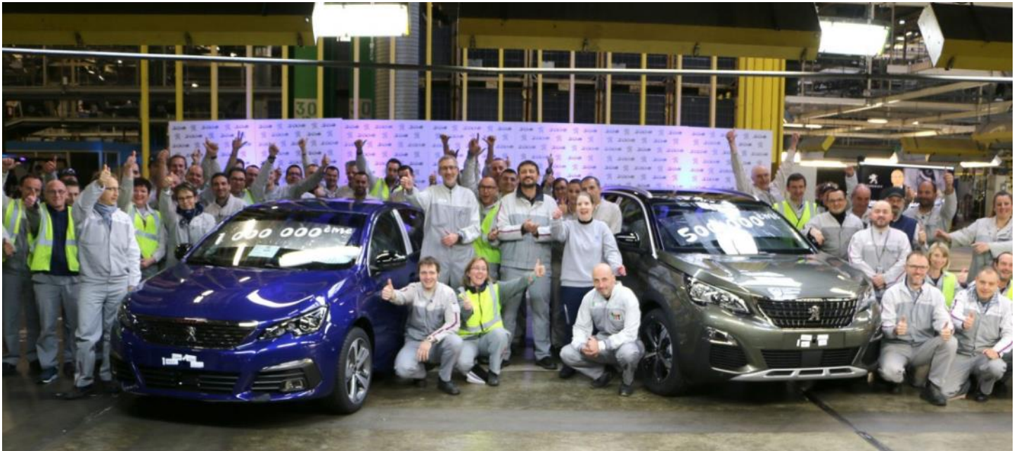
Mardi 27 novembre 2018 : Peugeot vient de produire son 500.000ème 3008 et sa millionième 308 à l'usine de Sochaux.