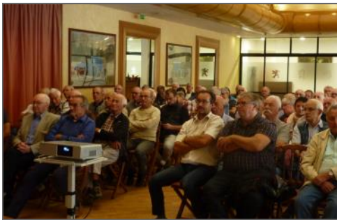
amateurs attentifs et ...

99 passionnés ont découvert le haut de gamme DS.