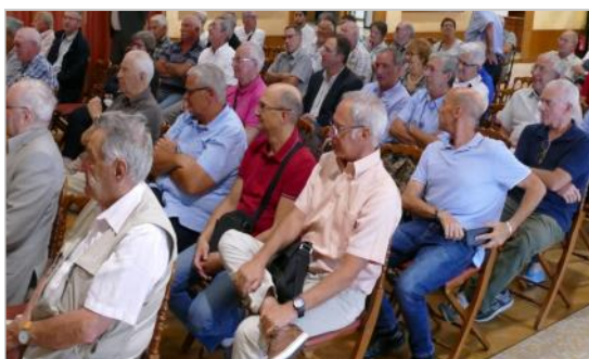
tous Sochaliens de cœur...

80 mordus ont assisté à la présentation par Olivier Desserprit des nouveautés 2018 de la marque Peugeot et en particulier de la nouvelle 508. Claude FRESICAL