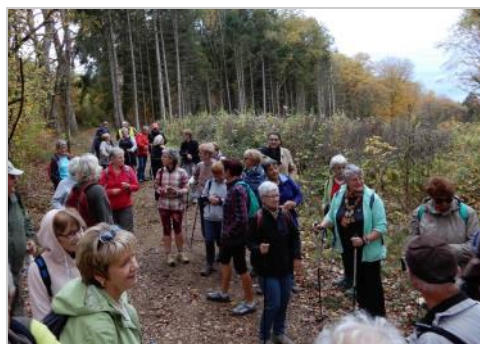
Saint Maurice Colombier : 6 novembre

Nos randonnées étant ouvertes à tous, nous ne pouvons qu'inciter nos sociétaires et leurs amis, passionnés de marche, à venir nous rejoindre lors des sorties 2019.