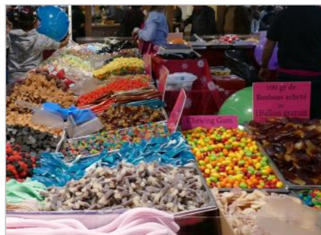
que de gourmandises !