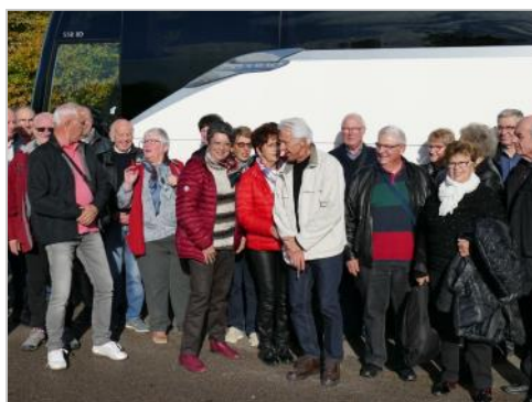
prêts pour la découverte des stands ...

27 inscrits à cette 88 e édition de la foire gastronomique de Dijon étaient fidèles au rendez-vous.