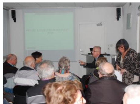
les intervenants du Crédit Mutuel.