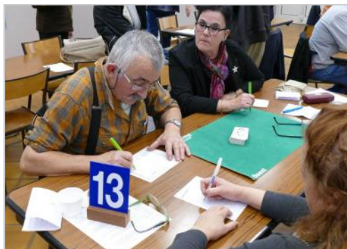
recomptage des points ...

52 participants ont répondu présents pour cette dernière édition de 2018.