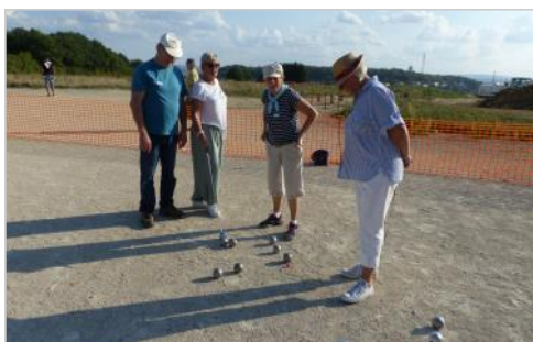
le point est acquis...

36 joueurs soit 18 doublettes tirées au sort ont profité d'un temps exceptionnel pour s'adonner à leur sport favori « les travaux de création d'un nouveau quartier près de la salle des sports de Grand Charmont n'ont pas découragé les adeptes de fanny ». Serge LAPORTE