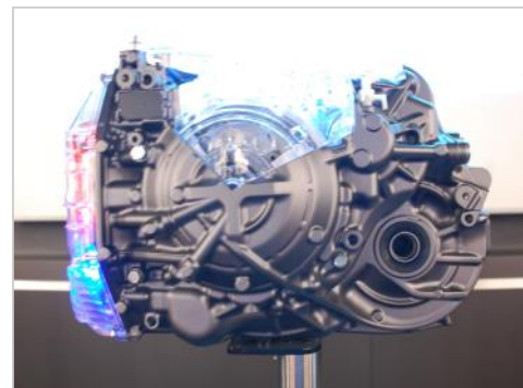
quel progrès !

115 personnes ont assisté à cette conférence. « le responsable du projet EAT8 a fait un récapitulatif de la transmission automatique depuis ses débuts, au cours des années 30 à nos jours ». Claude FRESICAL