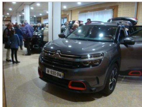
nouveau SUV C5 AIRCROSS.