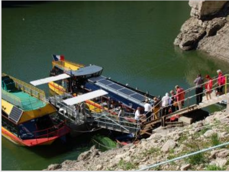
gymnastique pour l'embarquement ...

53 personnes étaient du voyage et n'auraient pas imaginé bénéficier d'un spectacle aussi déroutant.