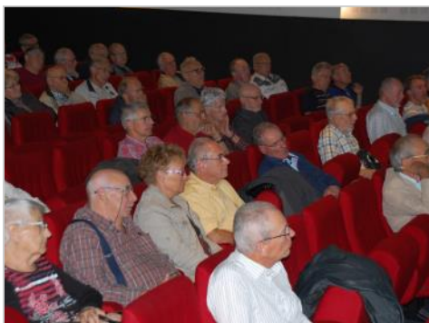
conquis par la BV Auto à 8 vitesses...

115 personnes ont assisté à cette conférence. « le responsable du projet EAT8 a fait un récapitulatif de la transmission automatique depuis ses débuts, au cours des années 30 à nos jours ». Claude FRESICAL