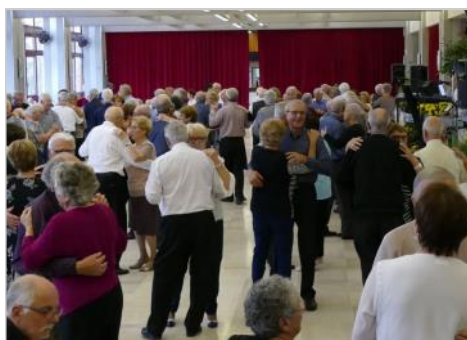
moment de convivialité .