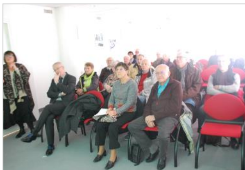
faible assistance, mais attentive et intéressée ...

30 personnes ont assisté à cette conférence.