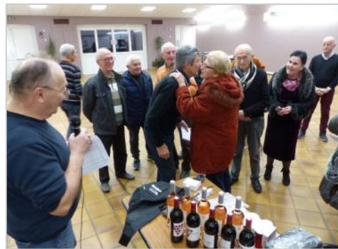
récompenses bien méritées.