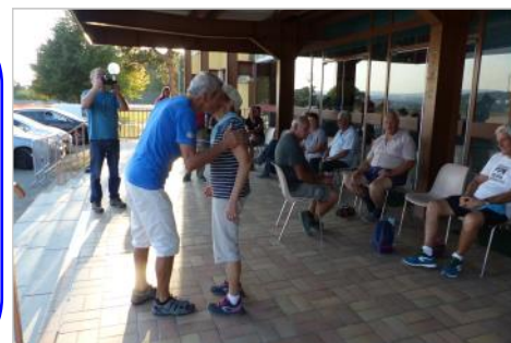
remise des prix aux dames.

36 joueurs soit 18 doublettes tirées au sort ont profité d'un temps exceptionnel pour s'adonner à leur sport favori « les travaux de création d'un nouveau quartier près de la salle des sports de Grand Charmont n'ont pas découragé les adeptes de fanny ». Serge LAPORTE