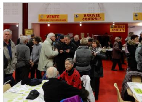
Lumières de Noël : 15 décembre

Merci à nos sympathiques accompagnateurs