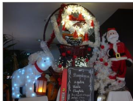
c'est bientôt Noël chez Berthe.