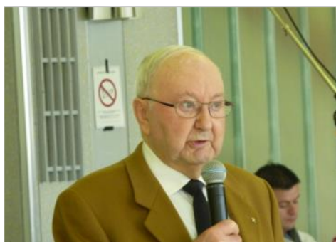
le mot du Président ...

205 amateurs de danse étaient réunis à l'occasion de la journée de l'Amitié 2018.