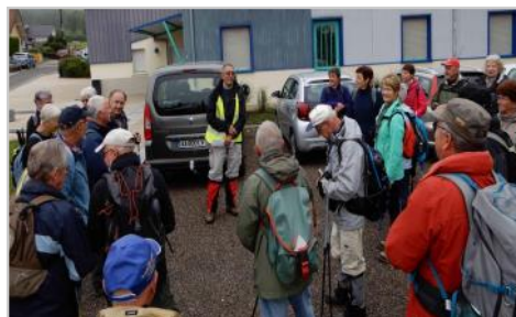
Les Boucles Chatenaises : 4 octobre