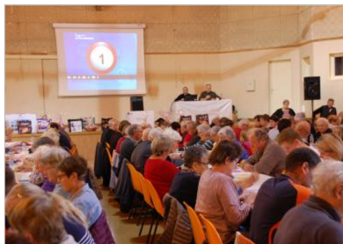
attentifs au tirage ...

197 amateurs de loto ont participé à cette édition d'automne qui s'est déroulée dans une très bonne ambiance.