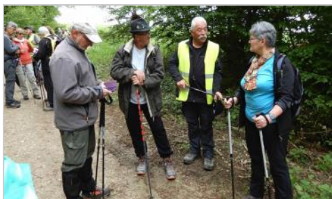
Roche d'Or de Réclère : 20 septembre