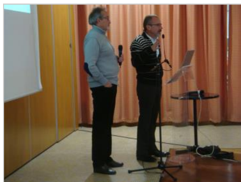
présentation bien documentée...

80 personnes ont assisté à cette présentation.