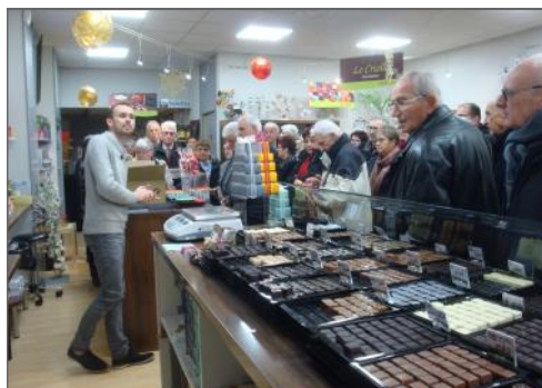
on se presse pour les chocolats ...