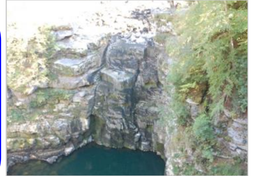
mais où est passée la chute d'eau ?