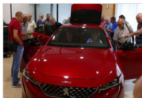
beau modèle... belle conception.

80 mordus ont assisté à la présentation par Olivier Desserprit des nouveautés 2018 de la marque Peugeot et en particulier de la nouvelle 508. Claude FRESICAL