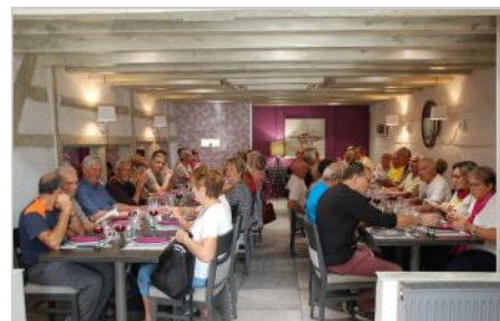
Montreux Jeune : 16 octobre

221 marcheurs ont participé aux cinq dernières sorties. « moments inoubliables de découvertes, de fatigue et partage d'émotions fortes font partie de ces virées, sans compter le plaisir de se retrouver autour d'un bon repas en fin de saison ».