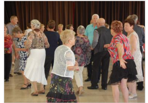
et bonne humeur !