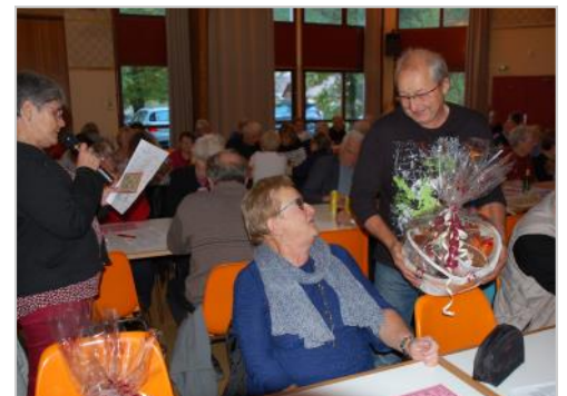
remise des lots !