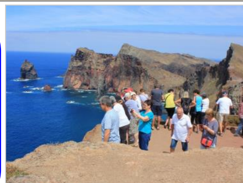
avec vue sur la mer ...