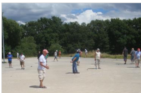
Prêts à pointer ...