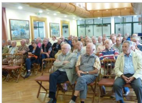
auditoire attentif ...