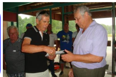
remise des récompenses ...