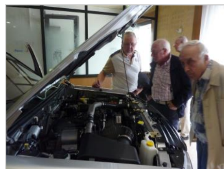
super le moteur ! ...