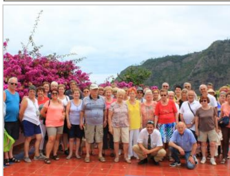
le groupe ...