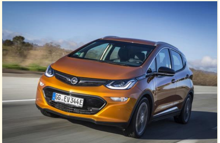
Nouvelle Opel « Ampera-e »