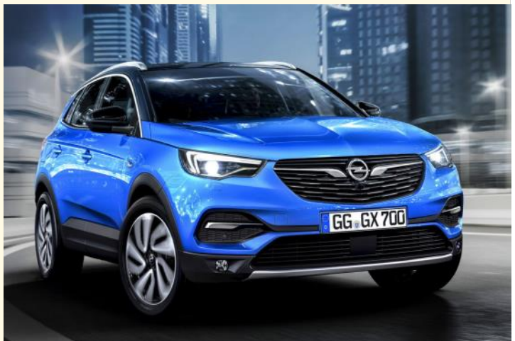
Nouvelle Opel «Grandland X» Fabriquée à Sochaux